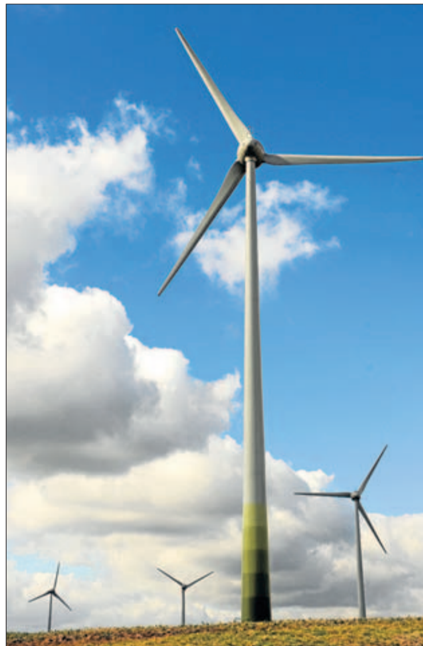
Wer in einen geschlossenen Fonds vor Ort investiert, ist Mitgesellschafter – einer Windkraftanlage zum Beispiel.

Fazit: Wer will, hat Möglichkeiten, sein Geld mit reinem Gewissen anzulegen, wie aber auch in allen anderen Fällen gilt: Drum prüfe wer sich – hier nicht ewig – bindet.