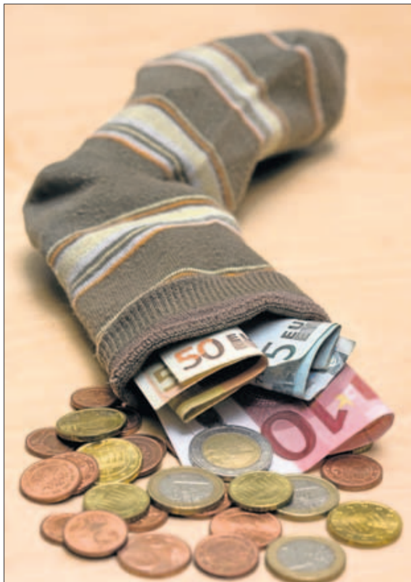
Für den klassischen Sparer sind Kombi-Sparangebote nichts, denn sie sind risikoreicher als der gute alte Sparstrumpf.

Für Kenner gibt es übrigens auch Möglichkeiten, mit noch geringeren Ausgabeaufschlägen – wenn überhaupt – und auch weniger Depotgebühren entsprechend sein Geld anzulegen.