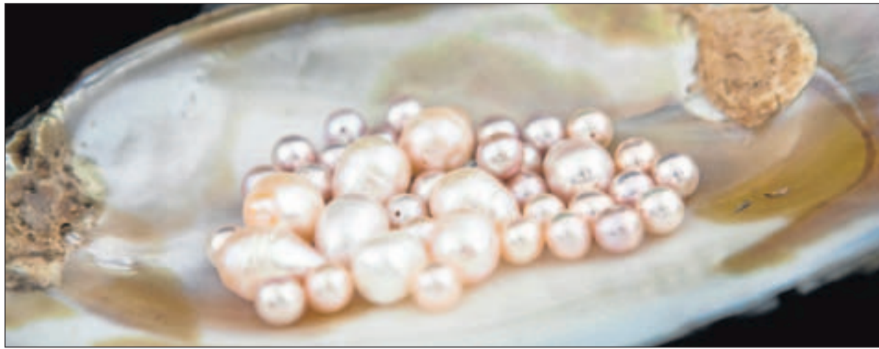
Sanft schimmernd und edel liegen chinesische Süßwasserperlen in einer Hyriopsis-Süßwassermuschel.

Um ihre Schönheit zu behalten und einem Alterungsprozess vorzubeugen, verlangen sie liebevolle Pflege und Behandlung. Perlschmuck sollte nicht längere Zeit der Sonne ausgesetzt sein oder in der Nähe der Heizung aufbewahrt werden. Wärme trocknet die Perle aus. Genauso schädlich wie zu große Trockenheit ist aber auch hohe